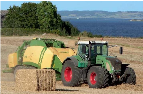
Рис. 2. Комбінований збиральний агрегат з активними робочими органами на базі трактора Fendt 920 Varіо та прес-підбирача Krone Big Pack 1290 ХС.

Цього недоліку позбулися сільськогосподарські агрегати у складі подібних машин, які агрегуються з тракторами моделі Fendt 900 Varіо, що мають безступеневі коробки передач (Рис. 2) [9].