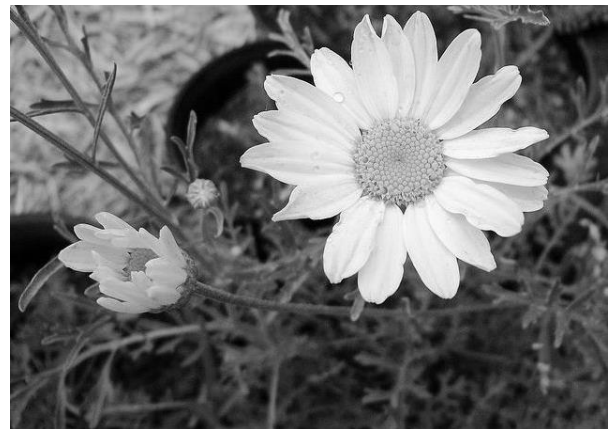
Рис. 1. Далматська ромашка ( Chrysanthemum cinerifolius або Pyrethrum cinerariifolium )

Пізніше було встановлено, що квітки декількох видів ромашки (рід Chrysanthemum родини Asteraceae – складноцвітих) мають інсектицидні властивості, але далматська ромашка ( Chrysanthemum cinerifolius або Pyrethrum cinerariifolium ) (рис. 1) суцвіття якої містять до 1,5 % піретринів, знайшла найбільше поширення.