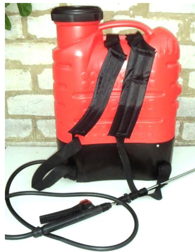
Рис. 6. Акумуляторний обприскувач Forte cl-16a

Обприскування проводили ранцевим акуму- ляторним обприскувачем Forte cl-16a (рис. 6), що дозволило рівномірно розподіляти робочу рідину по поверхні листків.