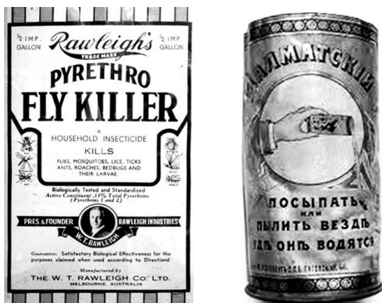
Рис. 2. Інсектицид "Вбивця літаючих комах"

Інсектицид "Вбивця літаючих комах" (рис. 2) проти побутових комах, що випускався в 30–40-х роках минулого століття та містив витяжку Піретрину 1 і Піретрину 2, про що свідчить напис на упаковці. В Російській імперії широко застосовували Далматський порошок з піретруму для обпилювання рослин.