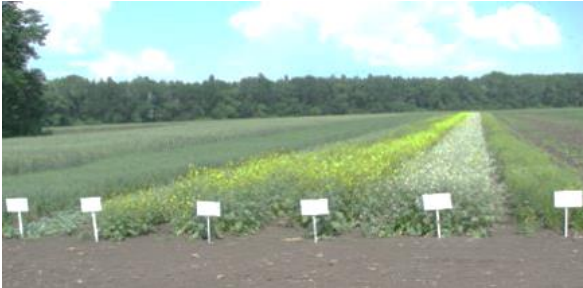
Рис. 4. Посіви олійних капустианих культур на полі ННВЦ «Дослідне поле» ХНАУ ім. В. В. Докучаєва (2020 р.)

посіву не було оброблено інсектицидними про- труйниками, так як зважаючи на досить вологу і дощову весну шкідники сходів (насамперед хре- стоцвіті блішки) є не надто шкідливими і рідко їх чисельність є загрозливою.