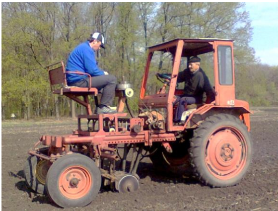
Рис. 5. Посів олійних капустианих культур се- лекційною сівалкою на полі ННВЦ «Дослідне поле» ХНАУ ім. В. В. Докучаєва, 2020 р.

Дослідження були проведені за загально- прийнятими методиками [3, 4].