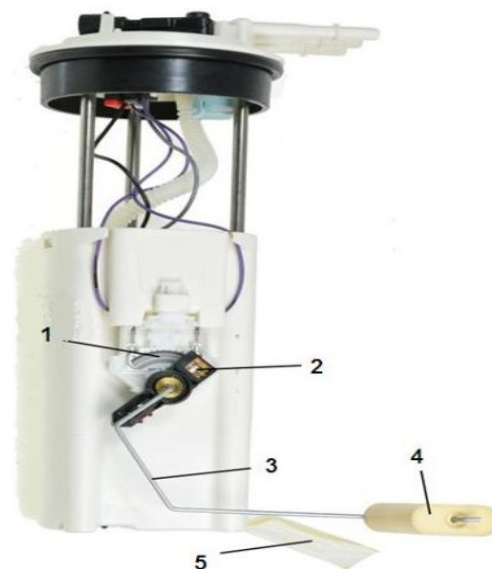
Рис. 1 Пристрій датчика рівня палива важільного типу: 1 – потенціометр; 2 – рухливий контакт бігунок; 3 – металевий важіль; 4 – поплавок; 5 – паливо вловлювач.

Важільний датчик рівня палива (рис. 1) – поплавок з'єднаний металевим важелем із рухомих контактом потенціометра. Сам потенціометр являє собою електричний пристрій, робота якого полягає у створенні опору току. Потенціометр виконаний у вигляді сектора, на який нанесені смуги резистивного матеріалу.