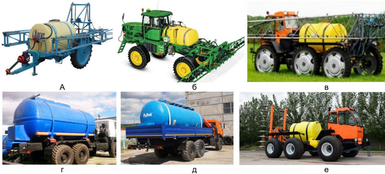
Рис. 1. Мобільні технологічні машини з баками, що приєднані бандажами а – причіпний обприскувач польовий малооб'ємний штанговий «Алекс»; б – самохідний обприскувач John Deere R4030; в – самохідний обприскувач Туман 2 на вузьких колесах; г – склопластикові автоцистерни для транспортування будь-яких рідин в т.ч. агресивних; д – автоцистерна для води і молока від компанії «Флотенк»; е – мультиінжектор на базі Туман 2

Обичайки баків піддаються складному навантаженню у вигляді дії ваги рідини, внутрішнього тиску (в окремих випадках), тиску бандажів та опор. Для визначення напружено-деформованого стану таких резервуарів необхідно скористатися однією із теорій оболонок, де в якості навантаження ввести розглядувані складові. Задача є доволі складною через багатогранність навантаження, що описуватиметься рядом математичних моделей, які з максимальною достовірністю описуватимуть реальне діюче навантаження.