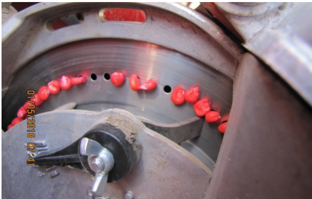
Рис. 3. Незаповненість насінням кукурудзи отворів висівного диска.

Дані таблиці по густоті посіву показують, що при встановленій нормі висіву в 2017 році насінин кукурудзи – 6,4 шт/п.м. та 14 шт/п.м. насінин сої в період повних сходів одержано сходів кукурудзи – 3,77 шт/п.м. та 6,5 шт/п.м. сходів сої, а в 2018 при встановленій нормі висіву кукурудзи 10,5 шт/п.м. та 18 шт/п.м. сої, одержано по 4,2 шт/ п.м. сходи кукурудзи та 14,8 шт/ п.м. сходів сої. Для виявлення головної причини цього явища було висунуте припущення, що не забезпечується встановлена норма висіву, тобто висівається менша кількість насіння, і однією з причин цього є недостатній рівень вакууму у висівних апаратах.