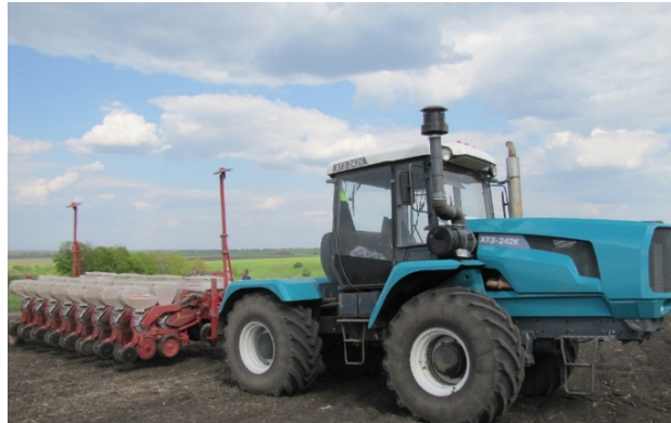
Рис. 1. Агрегат для сумісних посівів кукурудзи та сої в складі трактора ХТЗ-242К та дослідного зразка спеціалізованої сівалки на базі «Vega-8 Profi»

– з трактором Беларус-1221.2 (рис. 2). Слід зазначити, що, як показали результати тензометрування, запас потужності при застосуванні трактора ХТЗ-242К був досить значним, що дозволило без обмежень проводити сівбу на швидкості до 12 км/год.