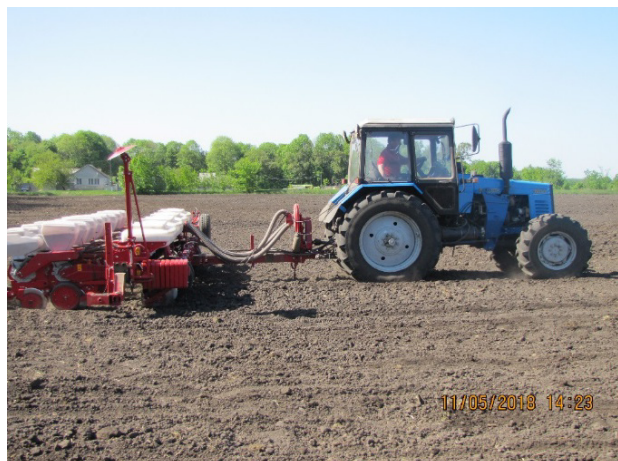
Рис. 2. Агрегат для сумісних посівів кукурудзи та сої в складі трактора «Беларусь 1221.2.» та сівалки на базі «Vega-8 Profi»

Як при дослідженнях в 2017 році, так і в 2018 році передпосівний обробіток проводився культиватором КПС-4. Стан поля, а також показники якості передпосівного обробітку наведені в табл. 3.