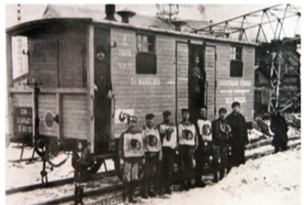
Рис. 4. Первая горноспасательная станция, 1907 год

Впервые вопрос об организации горноспасательной службы в России под давлением общественности был рассмотрен на XXVII съезде горнопромышленников Юга России в 1902 г. Постановлением этого съезда была установлена необходимость организации нескольких спасательных станций на наиболее опасных рудниках Донбасса. Съезд избрал Комиссию, которой было поручено собрать данные о борьбе с авариями и об устройстве зарубежных горноспасательных станций. Возглавил комиссию инженер Фрезе, который в течение нескольких лет «изучал» и «собирал» материалы, по Только в 1907 г. XXXII съезд горнопромышленников Юга России принял решение об организации вначале одной спасательной станции на средства съезда и об открытии в дальнейшем семи горноспасательных станций на наиболее опасных шахтах (рис. 4). каждому поводу тормозя решение этого важного вопроса.