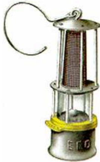
Рис. 2. Вариант Лампы Вольфа применявшийся в Российской Империи до 70-х годов XIX века

В 1888 г. Д.И. Менделеев сделал первый анализ газа суфляра из шахты «Капитальная» (Макеевка). В 1890 г. Профессором Н.Д. Коцовским и академиком Н.С. Курнаковым, обследовавшими шахты Донбасса, было установлено наличие значительного выделения газа, неудовлетворительное проветривание шахт и предложено в качестве меры борьбы с метаном его выжигание. Несмотря на то, что через полгода после этого обследования, 4 января 1891 г., произошел первый крупный взрыв на шахте № 14 Рыковских копий (г. Донецк), в результате которого погибли 55 шахтеров, серьезного внимания на борьбу с рудничным газом обращено не было.