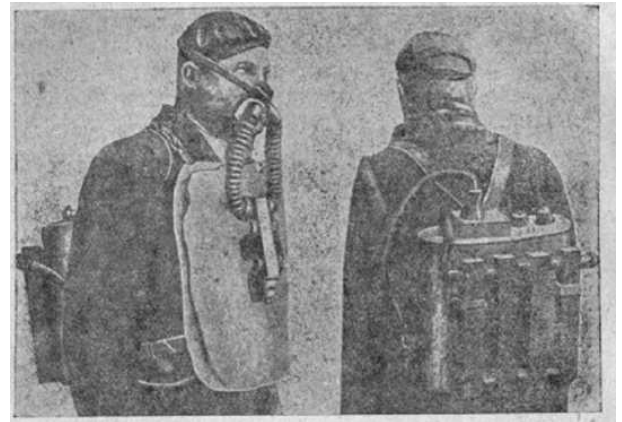
Рис. 9. Кислородный «оживляющий» аппарат Левицкого «Макеевка».

специализировавшаяся на горноспасательном оборудовании, переконструировала свой аппарат с учетом его замечаний [9].