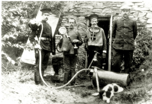
Рис. 7. Занятия горноспасателей в дымном штреке Макеевской станции, 1913 г

Горный инженер Д.Г. Левицкий, бывший в течение ряда лет заведующим Макеевской спасательной станцией, еще в 1911 г. сконструировал и изготовил новый по идее респиратор, назвав его «Макеевка», отличавшийся от зарубежных резервуарных аппаратов физической регенерацией используемого воздуха. К сожалению, конкретных фактов по устройству этого аппарата, намного опередившего иностранные аналоги, в современных публикациях приводятся мало. Целью данной статьи было устранить пробелы в истории отечественной науки и техники.