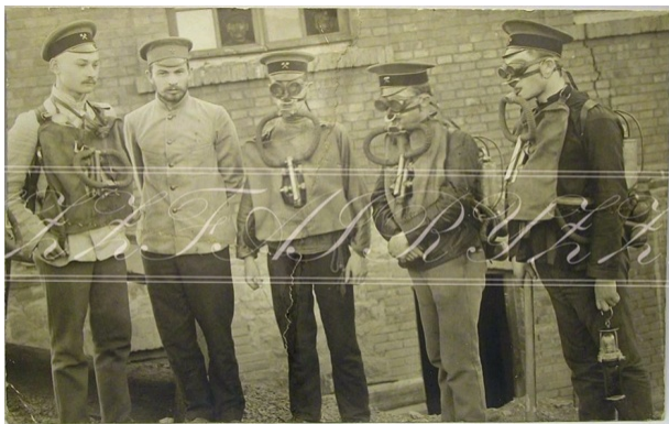
Рис. 6. Спасательная команда. Донецкий бассейн. Дыхательные аппараты германской фирмы «Dräger»