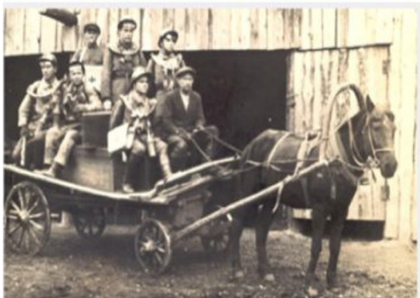
Рис. 5. Выезд горноспасательной дружины на шахту

Все имеющееся горноспасательное оборудование было иностранным, в России такое оборудование не производилось. Первым начальником Центральной Макеевской горноспасательной станции был горный инженер Иосиф Иосифович Федорович.