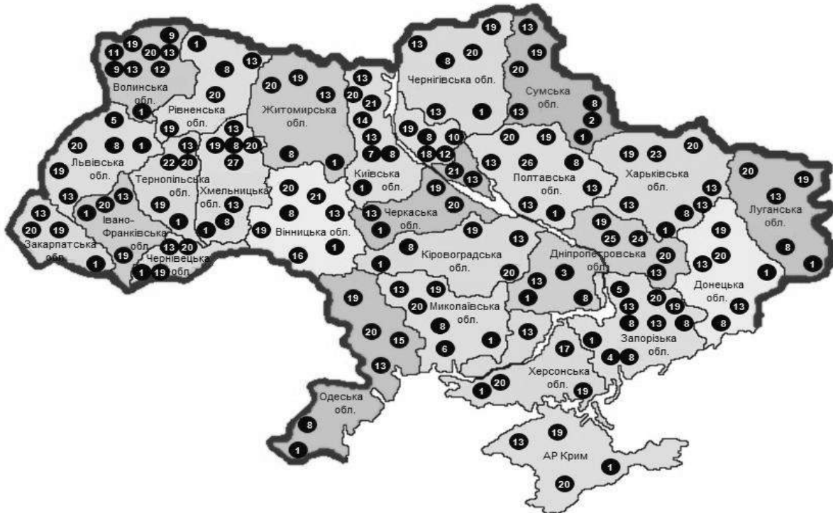
Рис. 1. Територіальне розташування фірм та їх філіалів які займаються продажем нової картоплезбиральної техніки.

Західноєвропейські фірми "ІМАС" (Італія), "Grimme" (Німеччина) та ін. пропонують здебільшого дворядні причіпні і напівначіпні картоплекопачі, які вкладають бульби у валок, а також підбирачі-навантажувачі, які збирають їх із валка.